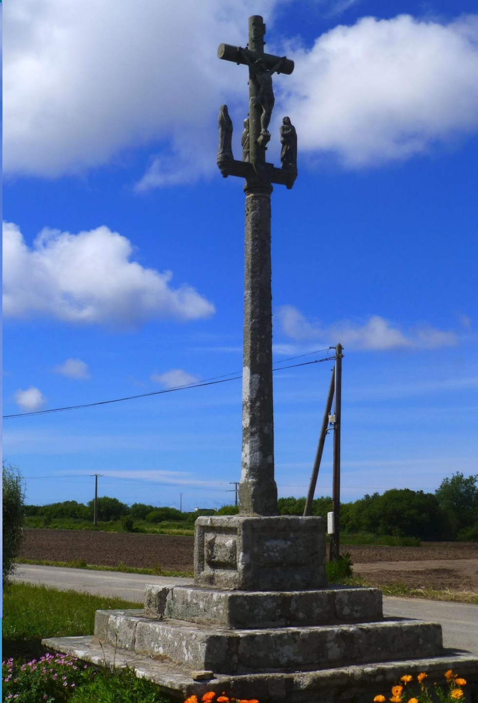
LESRADENNEC DOS ET FACE