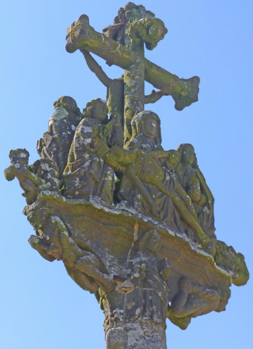
GUICLAN FACE ET DOS