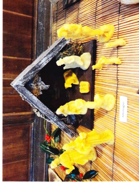
Crèche allemande. Personnages en cire