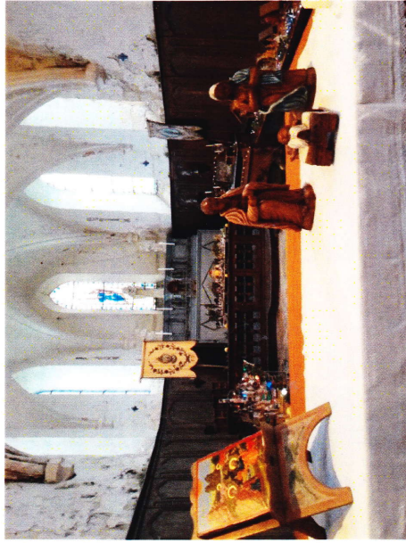
Vue de l'exposition dans l'église de Fontenay-Torcy

Chaque année l'association "Culture et patrimoine de Fontenay -Torcy" organise dans l'église une exposition de crèches. En voici quelques-unes