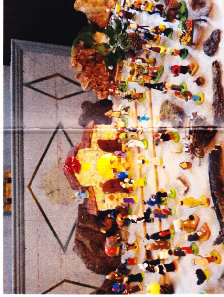
Crèche de Provence